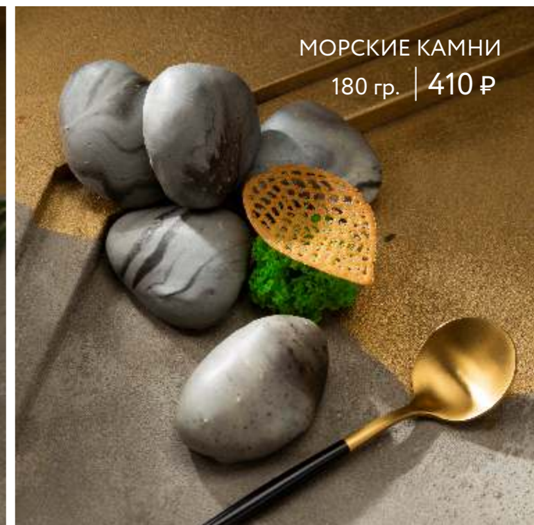
МОРСКИЕ КАМНИ 180 гр. | 410 ₺