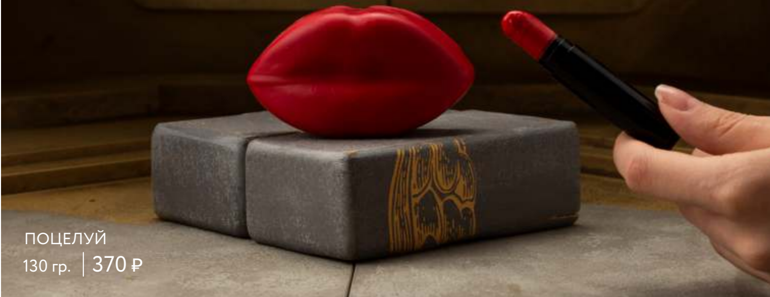
ПОЦЕЛУЙ 130 гр. | 370 ₺