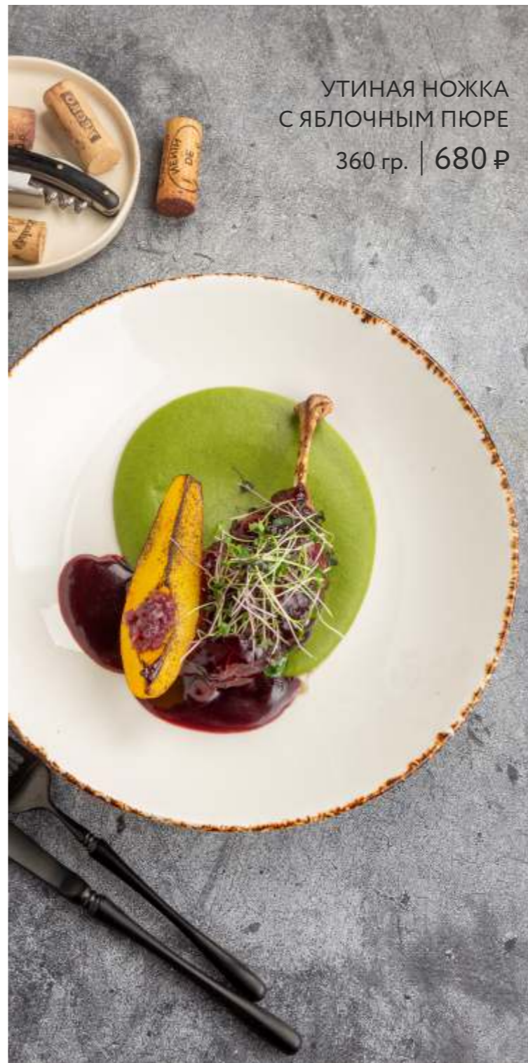
УТИНАЯ НОЖКА С ЯБЛОЧНЫМ ПЮРЕ 360 гр. | 680 ₹