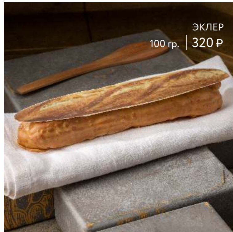
ЭКЛЕР 100 гр. | 320 ₺