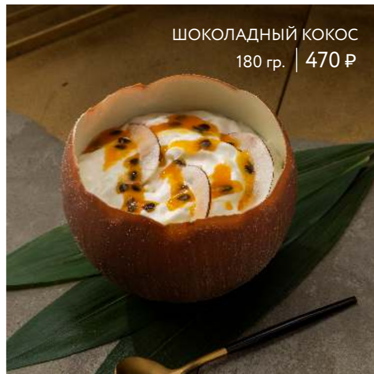
ШОКОЛАДНЫЙ КОКОС 180 гр. | 470 ₺