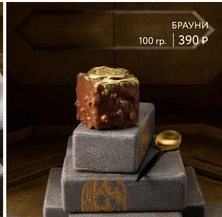
БРАУНИ 100 гр. | 390 ₺