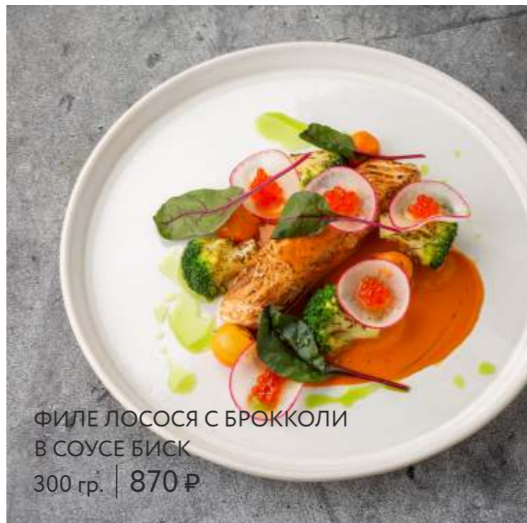
ФИЛЕ ЛОСОСЯ С БРОККОЛИ В СОУСЕ БИСК 300 гр. | 870 ₹