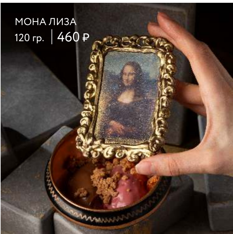
МОНА ЛИЗА 120 гр. | 460 ₺