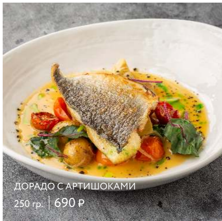
ДОРАДО С АРТИШОКАМИ 250 гр. | 690 ₹