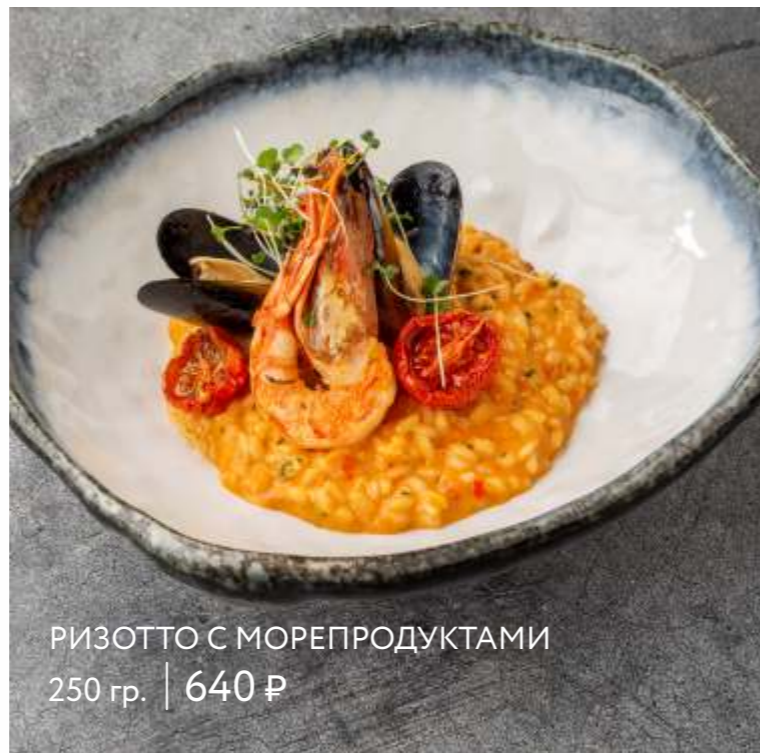
РИЗОТТО С МОРЕПРОДУКТАМИ 250 гр. | 640 ₹